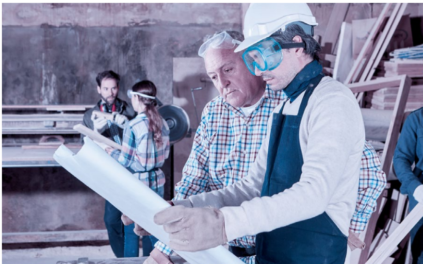
Auch wenn dem Patron etwas zustösst, soll die Firma weiterlaufen.

Wenn die Eheleute keinen ausserordentlichen Güterstand im Rahmen eines Ehevertrags vereinbart haben, gelten die gesetzlichen Bestimmungen der Errungenschaftsbeteiligung. Während jeder Ehegatte sein Eigengut behalten kann – Vermögen, das in die Ehe mitgebracht wurde sowie Erbschaften und Schenkungen –, ist die Errungenschaft, das während der Ehe erworbene Vermögen, hälftig zu teilen. Stellt das Unternehmen Errungenschaft dar, steht dem Ehepartner des Unternehmers grundsätzlich die Hälfte des Nettowerts des Unternehmens zu, insbesondere dann, wenn er während der Ehe dauernd nicht berufstätig war. Hohe Ersatzforderungen können auch entstehen, wenn der Unternehmer aus den laufenden Einnahmen oder aber der Nichtunternehmer aus seinem Eigengut in das Unternehmen investiert hat. Zum Schutz des Unternehmens können Vermögenswerte, die das Unternehmen verkörpern, zu Eigengut erklärt werden.