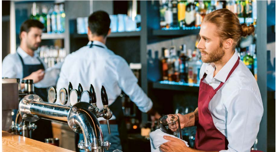
Der individuelle Anspruch auf bezahlte Feiertage hängt vom Anstellungsverhältnis ab.

Bei Teilzeitmitarbeitenden mit festen Arbeitstagen ist die Situation relativ einfach: Fällt ein Feiertag auf einen ihrer regulären Arbeitstage, haben sie frei und erhalten ihren normalen Lohn. Komplizierter wird es bei flexiblen Arbeitstagen. Hier empfiehlt sich eine anteilmässige Berechnung des Feiertagsanspruchs. Beispiel: Ein 50%-Mitarbeiter hätte bei 10 Feiertagen pro Jahr Anspruch auf 5 bezahlte Feiertage. Diese können dann flexibel zugeteilt oder als Zeitguthaben verrechnet werden.